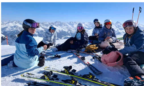
BERICHT AUS DAVOS SEITE 4+5 SKILAGERBERICHT DER 1. REALKLASSEN