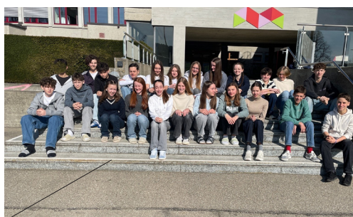
NEUES AUFNAHMEVERFAHREN SEITE 6 MIT VORNOTEN, OHNE MÜNDLICHE TESTS