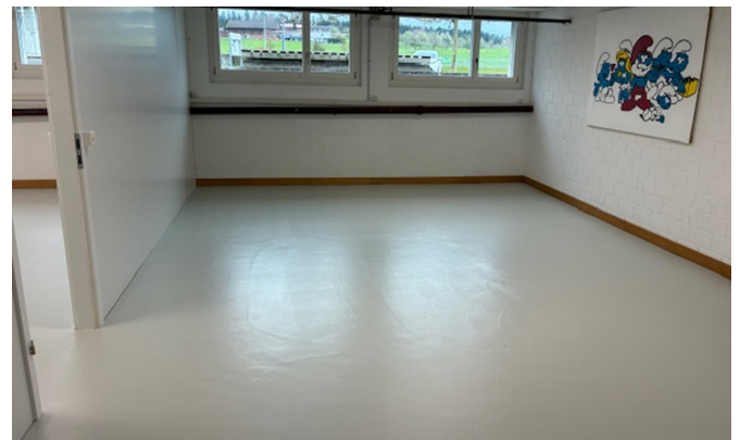
Aufenthaltsraum: erweitert und neu gestrichen.

Besonders erfreulich ist, dass die Jugendlichen den Raum teilweise selbst mitgestalten. Mit eigenen Ideen und Beiträgen tragen sie dazu bei, dass der Aufenthaltsraum eine angenehme und persönliche Atmosphäre erhält.