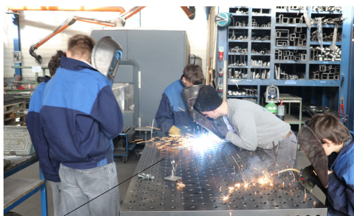
DISCOVERY DAY SEITE 2 LERNEN VOR ORT IN DER ARBEITSWELT